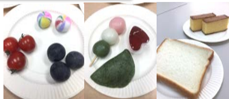
硬くてツルツと丸いもの